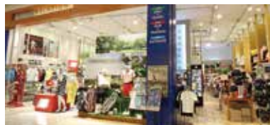
トランスレーション イオンモールナゴヤドーム前店