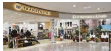
トランスレーション / ナグヨガスタジオ & フィットネス 則武新町店