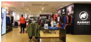
トランスレーション ナディアパーククリアーレ店