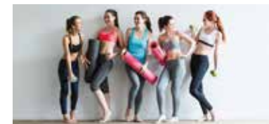
ナグ ヨガスタジオ イオンモールナゴヤドーム前店