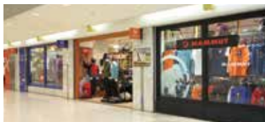
トランスレーション アウトドアスタイル名古屋駅店

モノをシーンの視点からとらえ、感動と創造をテーマに。Comfotable Sports Lifestyle.