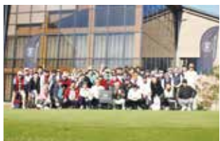
第 13 回 トランスレーションゴルフコンバ

(株) QVC JAPAN (株) 東急ハンズ JR 東海(株) NSK イオンモール(株) (株) ジェイアール東海高島屋 (株) ビームス (株) シップス (株) ユナイテッドアローズ ヤフー(株) (株) ワールド (株) バトルクラブ アマゾンジャパン(株) (株) エンジョー 楽天(株) (株) ブラザハウス アッシュ・ペー・フランス(株) (株) ファイブフォックス (株) テット・オム (株) 三陽商会 (株) テクストレーディングカンパニー (株) eSPORTS (株) デルフォニック